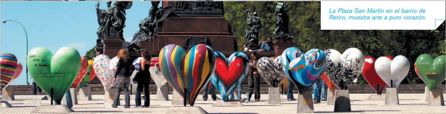
La Plaza San Martín en el barrio de Retiro, muestra arte a puro corazón.